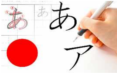
Hiragana & Katakana